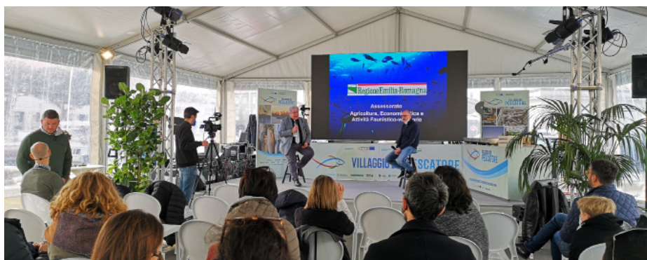
L'événement Fit4Blue organisé à Cesenatico le 27 mars 2022 par le partenaire de FISH MED NET Haliéus avec la coopérative de recherche halieutique MARE où le projet FISH MED NET a été présenté.

Un événement présentant FISH MED NET et Fit4Blue aura lieu en Corse le 30 mai 2022. La rencontre portera sur le thème de la diversification des activités de la pêche professionnelle et notamment l'application du principe de multifonctionnalité sur l'île. Ils seront respectivement introduits par la Communauté de Communes du Sud Corse et la coopérative insulaire Petra Patrimonia Corsica.