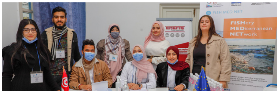
1ère table ronde nationale en Tunisie le 4 décembre 2021 : Opportunités et contraintes du partenariat public-privé.

L'Association Tunisienne pour le Développement de la Pêche Artisanale a organisé la première table ronde nationale le 4 décembre 2021, où des représentants des administrations publiques, des pêcheurs, des conchyliculteurs, des exploitants de barrages, des étudiants et des exportateurs de produits de la mer ont discuté ensemble des différentes opportunités et contraintes du PPP. Le débat a été conduit vers une volonté de s'engager dans une refonte du cadre réglementaire lié au PPP qui n'est pas adapté à la pêche artisanale. Cette table ronde a été un événement productif et réussi grâce à la présence des médias nationaux tunisiens, avec un total de 11 articles de presse, 2 interviews à la radio et 1 interview diffusée au journal de 20h. Parallèlement à la prospection sur le terrain, des entretiens avec des travailleurs du secteur de la pêche ont été l'occasion de diffuser le projet FISH MED NET et de mettre en évidence l'évolution des activités de pêche en Tunisie à travers le tournage de vidéos capsules.